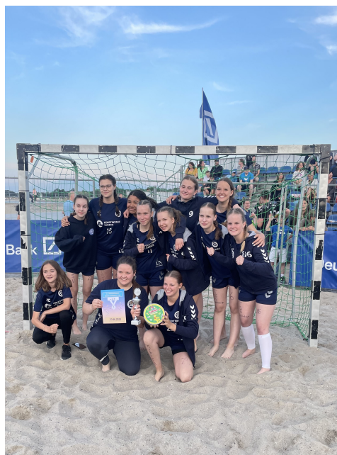
Stolz wird der Pokal präsentiert. Tolle Leistung!

Ungewohntes Regelwerk für das Publikum: Stetiger Reihenwechsel nach jedem Spielzug. Wie gut, dass fast der gesamte Kader zur Verfügung stand. Beeke war verletzungsbedingt nicht dabei, drückte im Publikum aber die Daumen. Dann die Besonderheit, dass in jeder Mannschaft drei Spielerinnen mit Leibchen spielten. Deren Tore zählten doppelt! Es galt also, taktisch vorzugehen und genau diese Spielerinnen immer wieder gefährlich in Szene zu setzen. Das