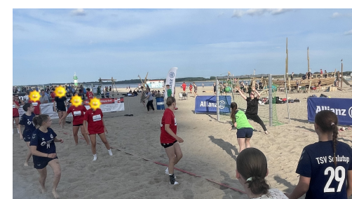
Kim trägt das grüne Leibchen. Das Tor zählt doppelt.